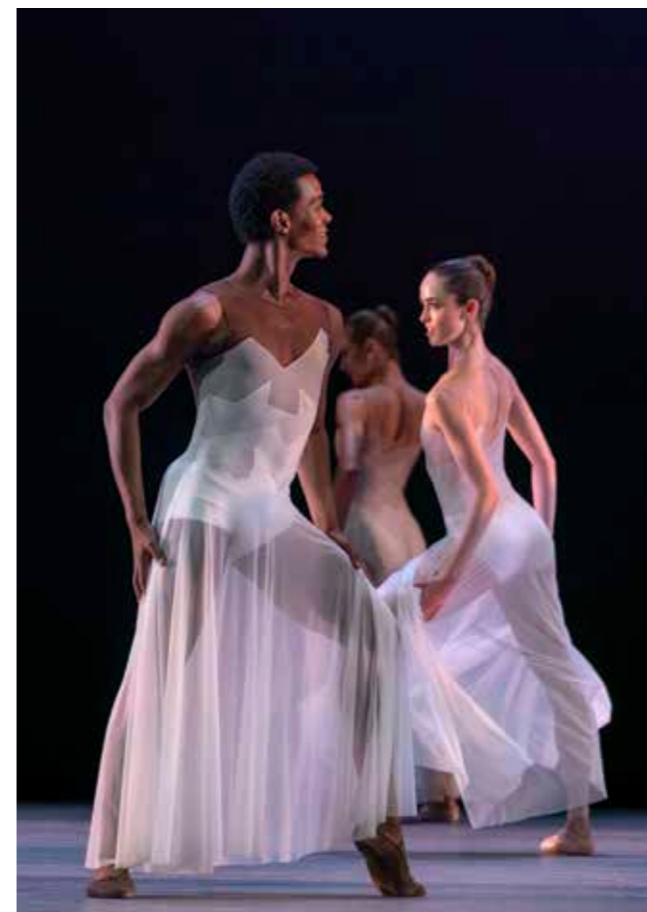
FOUR TEMPERAMENTS, THE CHAIRMAN DANCES

Als één choreograaf de ontwikkeling van de hedendaagse danskunst heeft beïnvloed en gestuurd, is het William Forsythe wel. De traditionele logica en dynamiek van het ballet zijn door hem stevig op hun kop gezet. Als ode aan deze internationaal meesterchoreograaf presenteerde Het Nationale Ballet, met steun van haar donateurs, tijdens het Holland Festival voor het eerst een programma met drie van zijn meesterwerken: The Vertiginous Thrill of Exactitude , Pas/Parts 2018 en de Nederlandse première van het internationaal bejubelde Blake Works I .