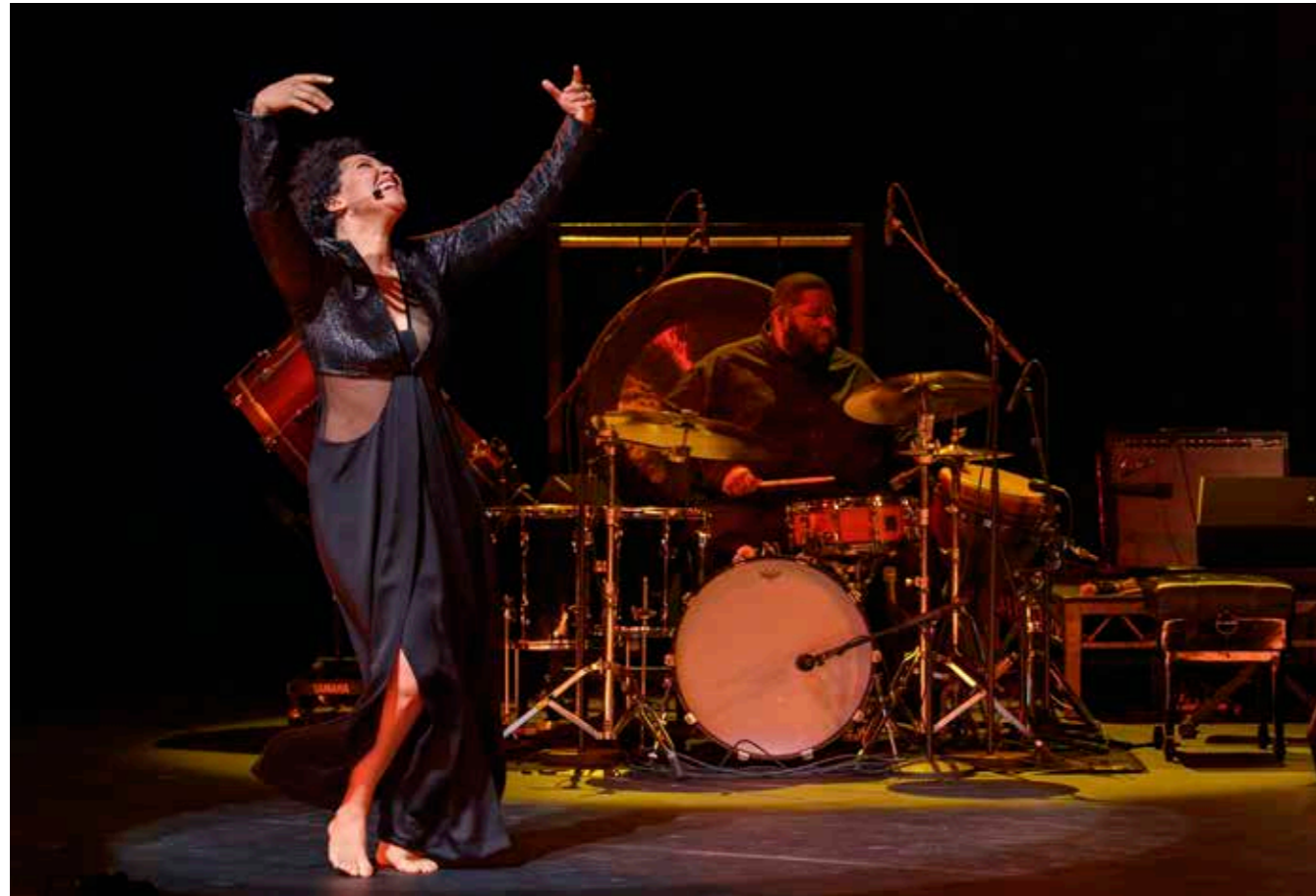
PERLE NOIRE - OFF 2023