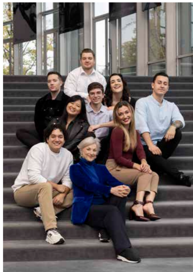
DE NATIONALE OPERA STUDIO

Het Opera Forward Festival (OFF) is een belangrijk platform voor jonge makers en voor de vernieuwing van de kunstvorm opera. De nieuwe werken die voor dit festival worden gemaakt, bieden bij uitstek de mogelijkheid om in te spelen op de hedendaagse maatschappelijke realiteit. Het thema van deze zevende editie van OFF was 'vrijheid en bevrijding': van de boerderijdieren die zich in de productie Animal Farm bevrijdden van het juk van hun meesters tot de vrijheidsdrang van de iconische performer Joséphine Baker in Perle Noire: Meditations for Joséphine en het streven naar een andere, betere wereld in Ändere die Welt! In de laatstgenoemde productie stonden de talenten van De Nationale Opera Studio centraal, met hun eigen talentproductie.