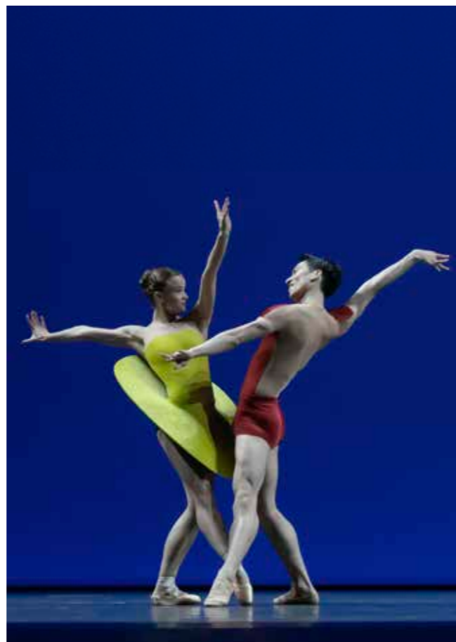
FORSYTHE FESTIVAL - THE VERTIGINOUS THRILL OF EXACTITUDE