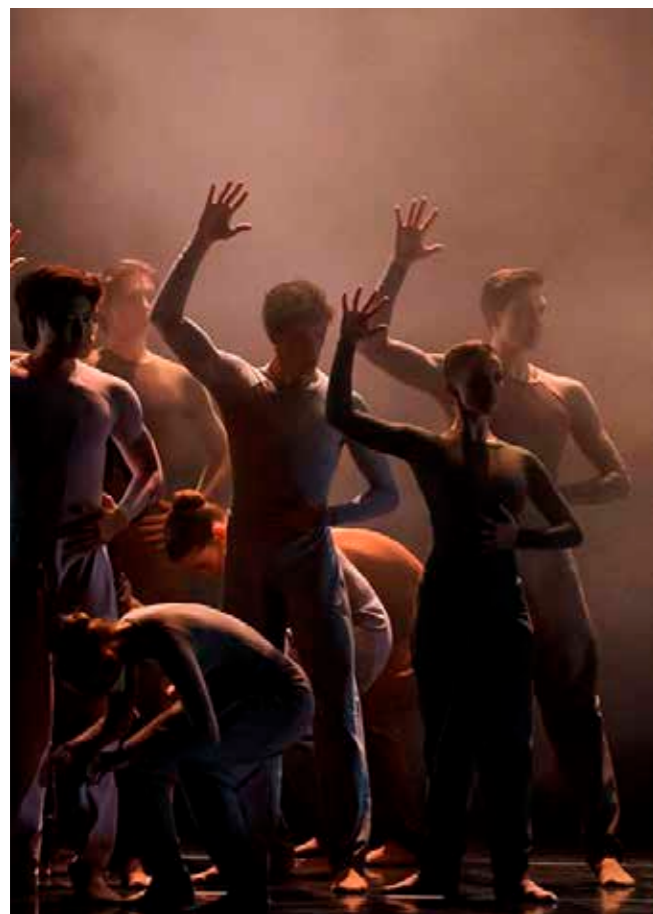
BALLET BUBBLES, REMEMBRANCE