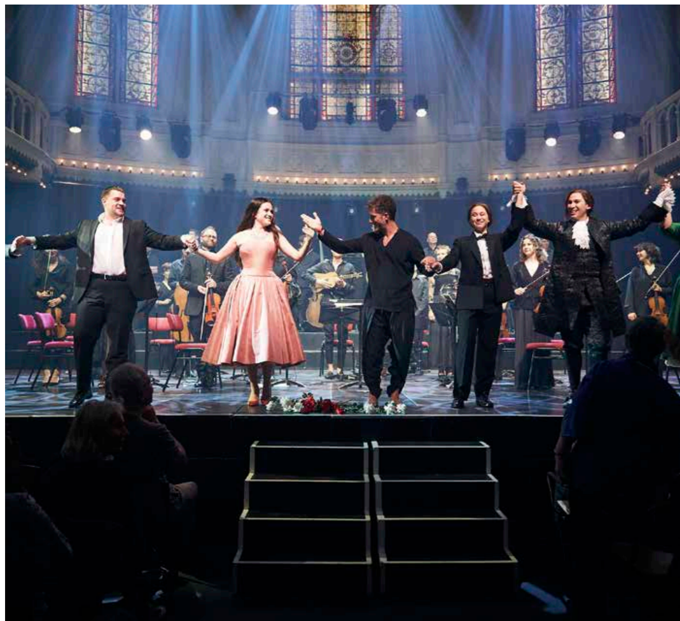
DE NATIONALE OPERA STUDIO IN PARADISO