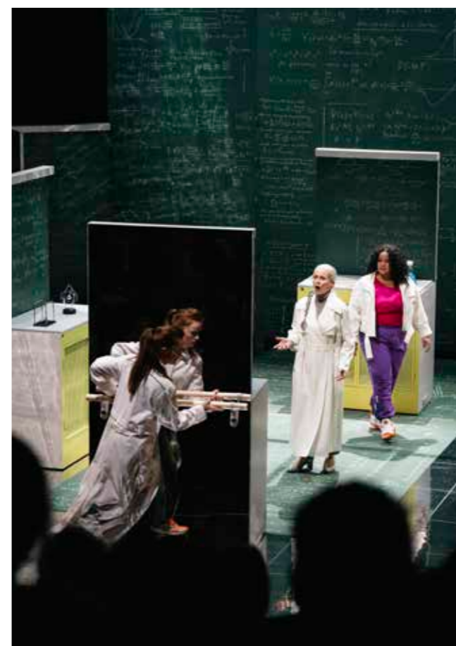
DE THEORIE VAN ALLES