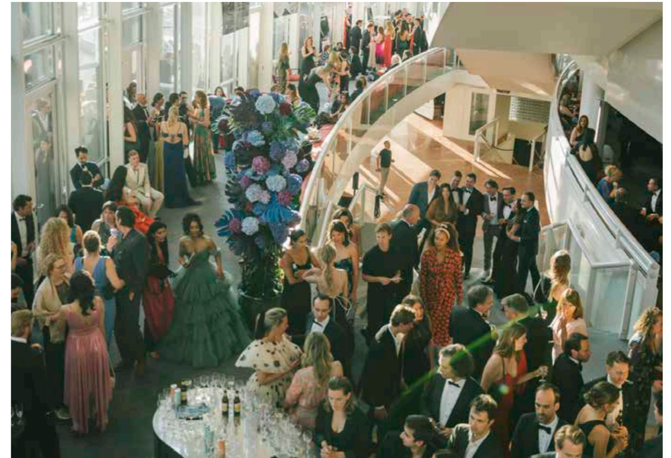
INTERNATIONAL YOUNG PATRONS CIRCLE GALA 2023

Niet alleen dragen particuliere schenkers bij aan de diverse kunstvormen, maar ook geven velen van hen aan Nationale Opera & Ballet als geheel. De volgende projecten werden in dit kader ondersteund.