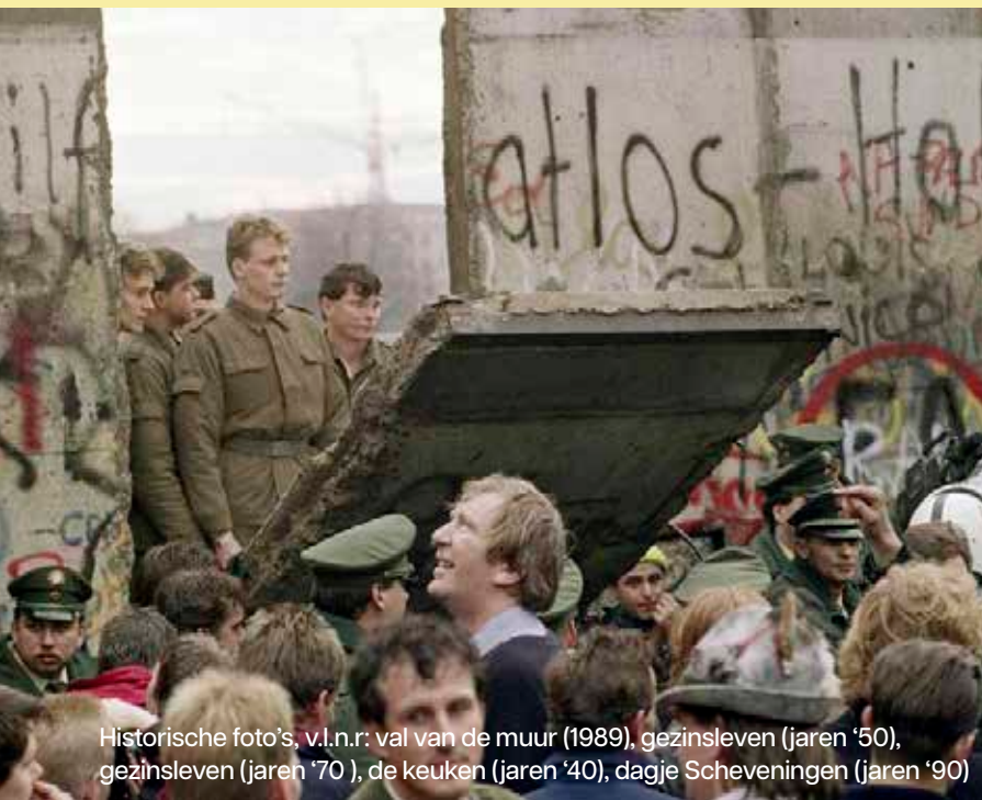
Historische foto's, v.l.n.r.: val van de muur (1989), gezinsleven (jaren '50), gezinsleven (jaren '70), de keuken (jaren '40), dagje Scheveningen (jaren '90)