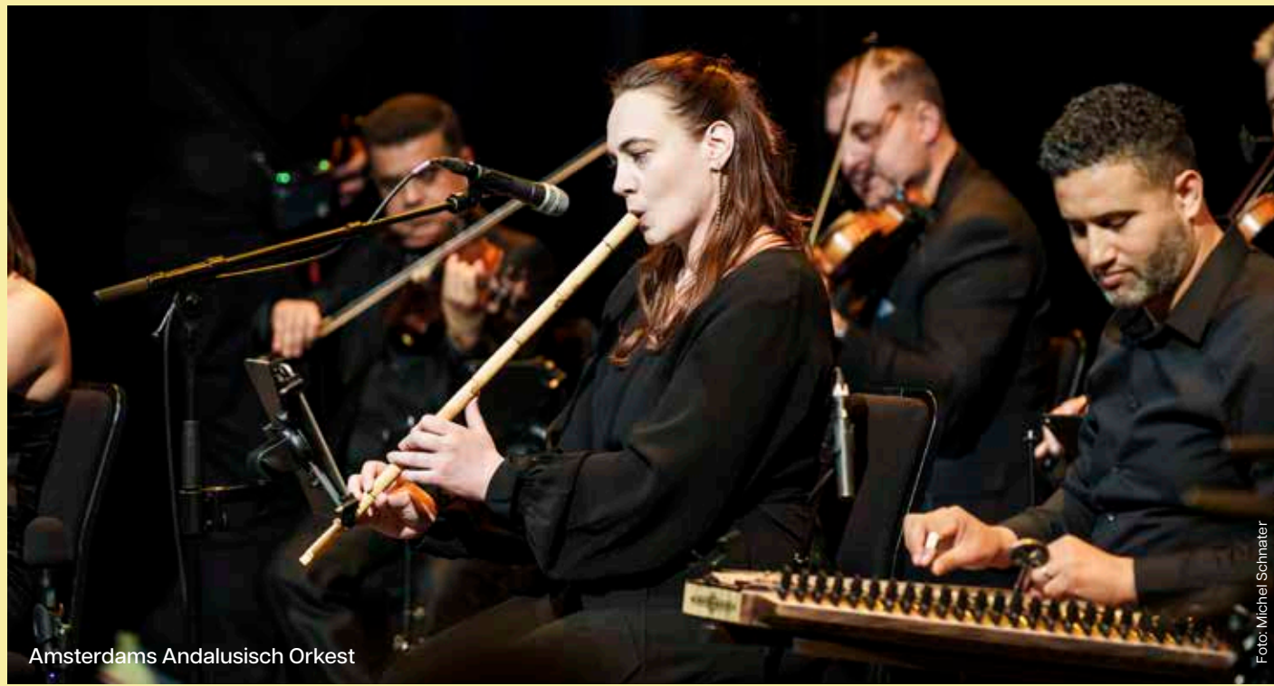
Amsterdams Andalusisch Orkest