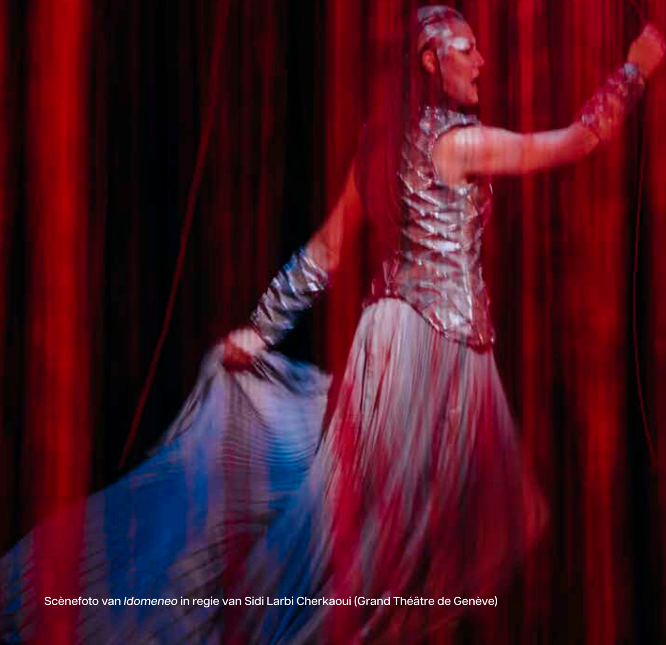
Scènefoto van Idomeneo in regie van Sidi Larbi Cherkaoui (Grand Théâtre de Genève)

“Ik nodig het publiek uit om opera anders te beleven”