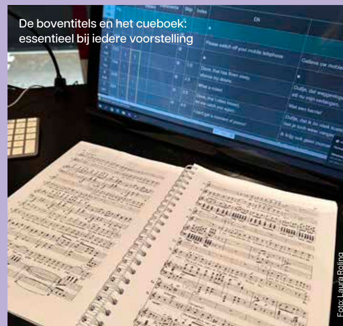
De boventitels en het cueboek: essentieel bij iedere voorstelling

Voorafgaand aan de repetities maakt Karssen de boventiteling op basis van een Nederlandse en een Engelse vertaling van het libretto. Tijdens de repetities kan er nog aan de details gewerkt worden, zodat de titels naadloos aansluiten bij wat er op het toneel gebeurt. “De titels moeten soms worden aangepast aan de regie, wanneer er dingen op het toneel gebeuren die niet helemaal overeenkomen met wat er in het libretto staat. Je moet zorgen dat het geheel klopt.”