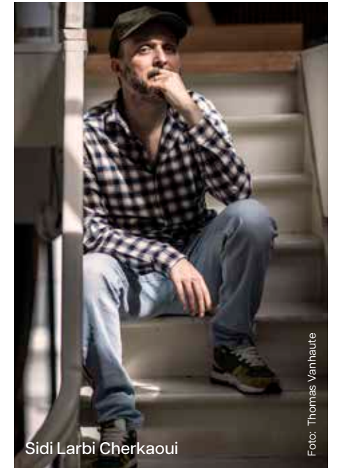
Sidi Larbi Cherkaoui