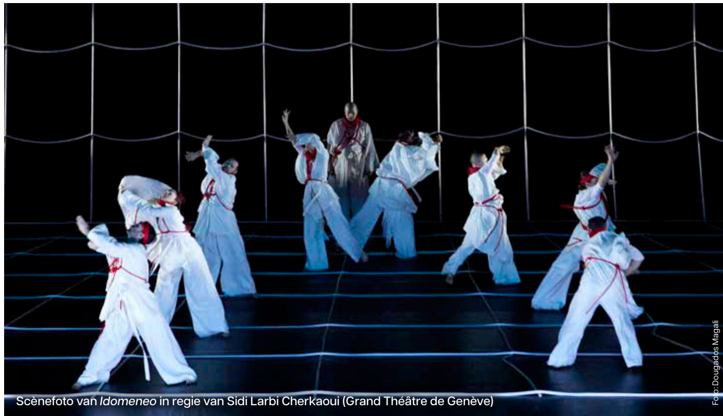
Scènefoto van Idomeneo in regie van Sidi Larbi Cherkaoui (Grand Théâtre de Genève)