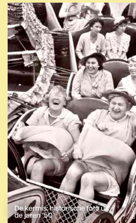
De kermis: historische foto uit de jaren '50