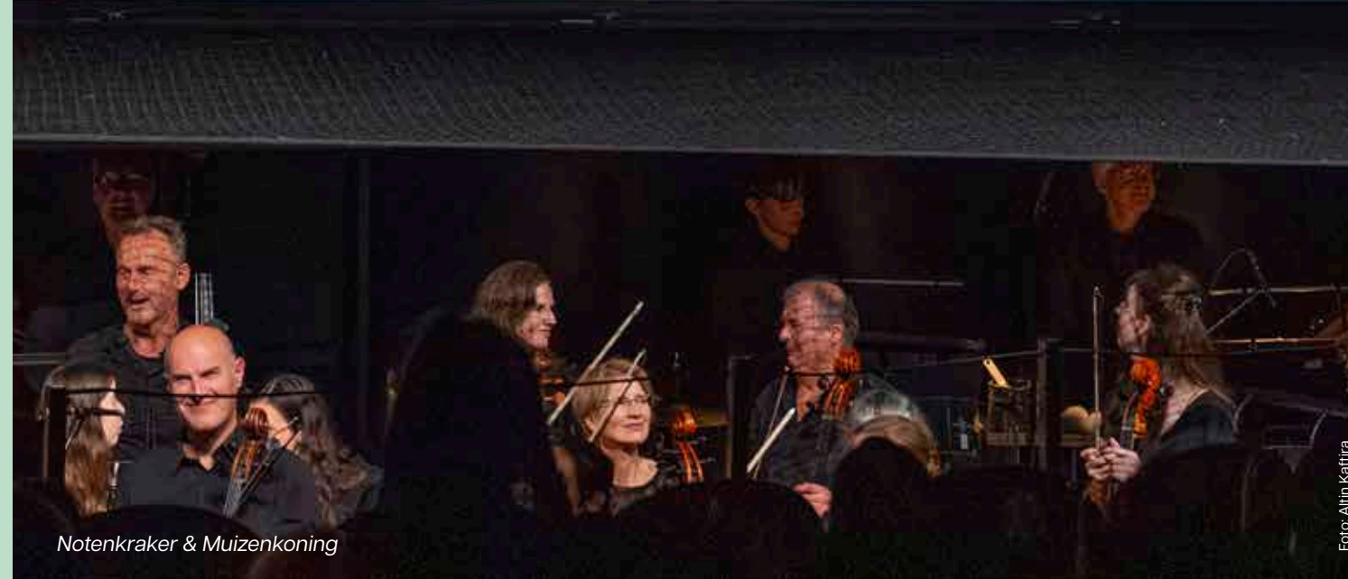
Notenkraker & Muizenkoning