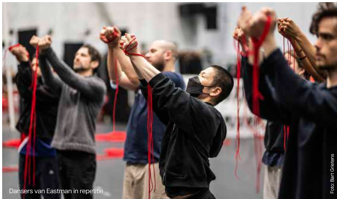
Dansers van Eastman in repetitie