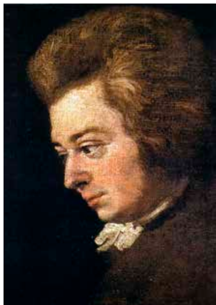
Schilderij: Joseph Lange