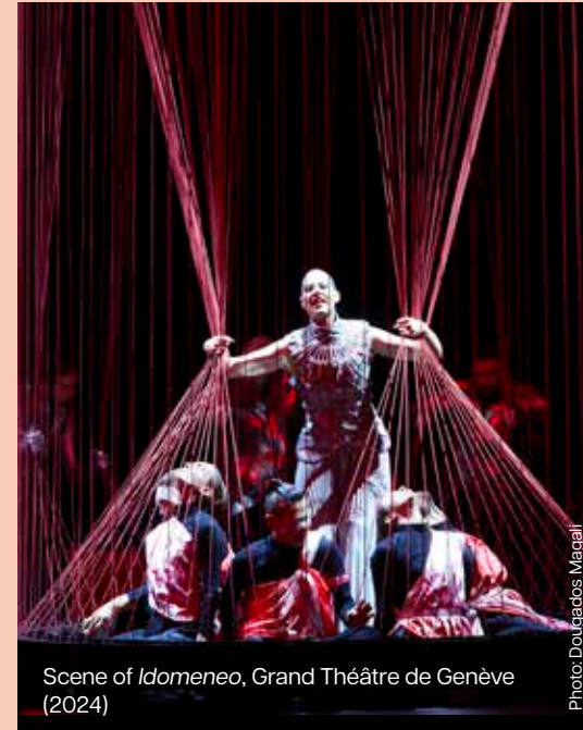
Scene of Idomeneo , Grand Théâtre de Genève (2024)