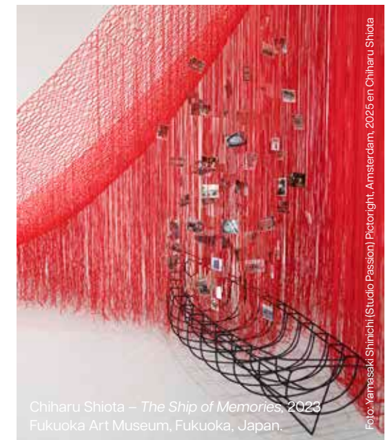
Chiharu Shiota – The Ship of Memories , 2023 Fukuoka Art Museum, Fukuoka, Japan.

→ Lees op p. 17 meer over het werk van Chiharu Shiota