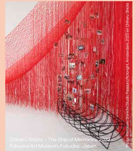
Chiharu Shiota – The Ship of Memories , 2023 Fukuoka Art Museum, Fukuoka, Japan.

For his Idomeneo , Sidi Larbi Cherkaoui invited prominent artists to give visual form to his theatrical interpretation with its emphasis on movement. The Japanese artist Chiharu Shiota created yarn sculptures to portray a world that is constantly being built up and demolished again. The red threads on the stage depict various situations and driving forces, such as the storm that besets Idomeneo's ships and the sea monster that Idamante heroically defeats. The Japanese fashion designer Yuima Nakazato designed costumes that exude both belligerence and vulnerability.