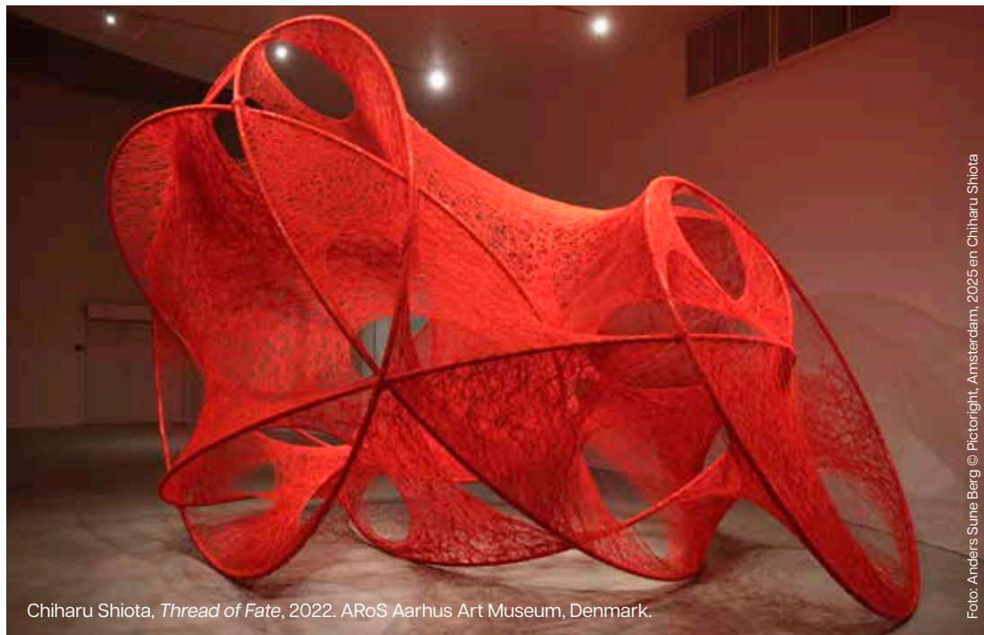
Chiharu Shiota, Thread of Fate , 2022. ARoS Aarhus Art Museum, Denmark.