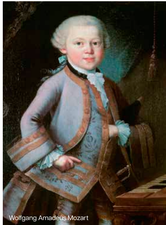
Wolfgang Amadeus Mozart