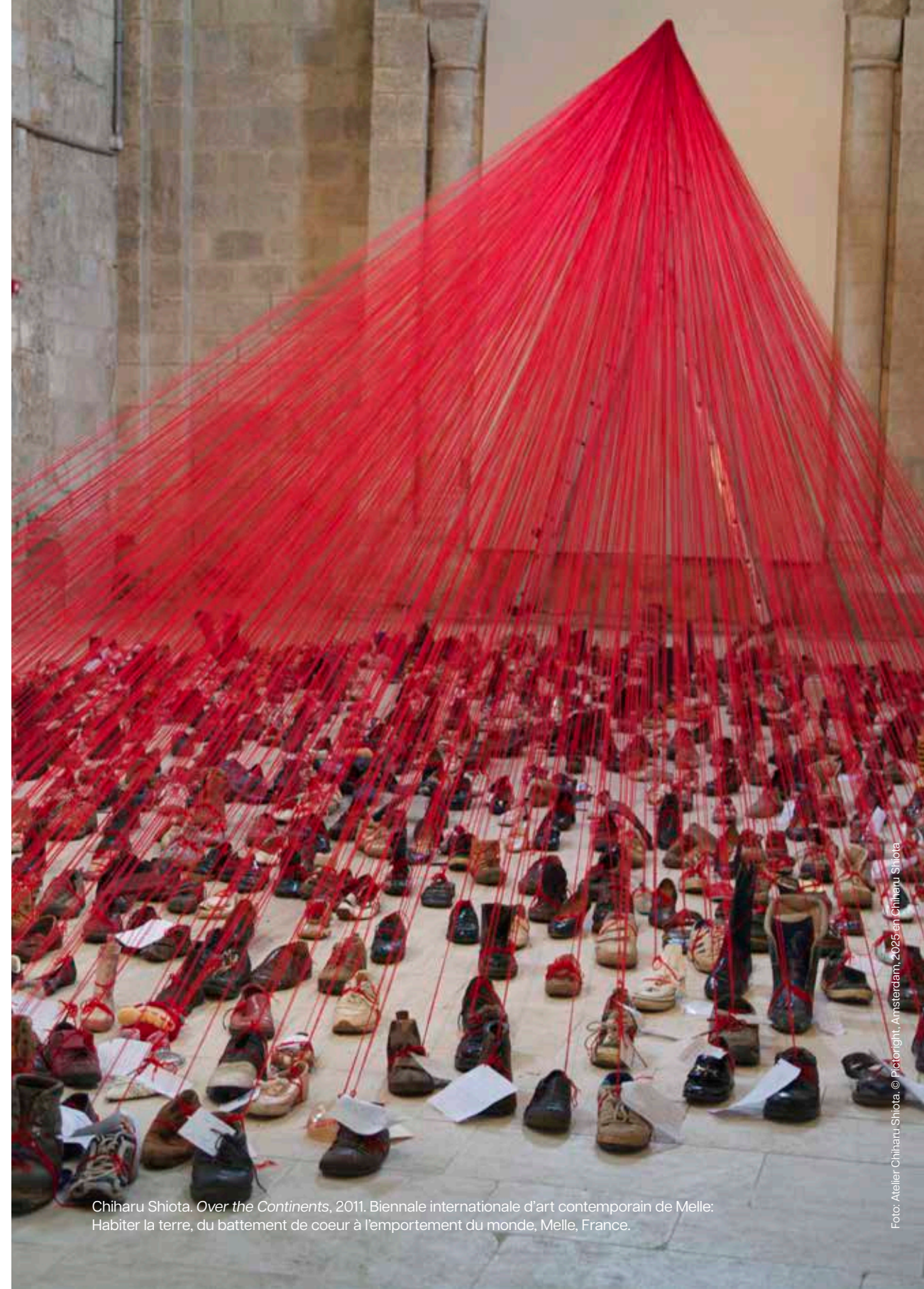
Chiharu Shiota, Over the Continents , 2011. Biennale internationale d'art contemporain de Melle: Habiter la terre, du battement de coeur à l'emportement du monde, Melle, France.