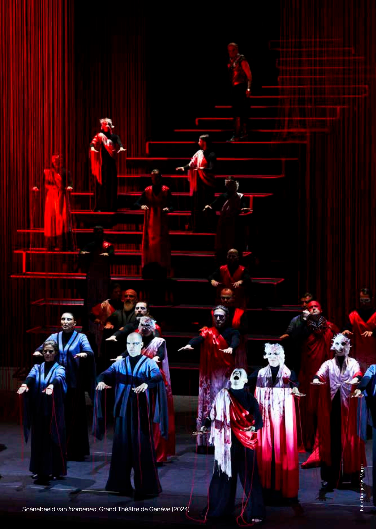
Scènebeeld van Idomeneo , Grand Théâtre de Genève (2024)

Then Idamante appears, having defeated the monster. He offers up his life so that the promise to Neptune will be fulfilled. Ilia, however, pleads to be allowed to take his place out of love for him. A voice announces that Neptune's anger will abate if Idomeneo abdicates in favour of Idamante and Ilia. Elettra must abandon her hope of marrying Idamante and is overwhelmed by rage, while Idomeneo, in a moment of madness, kills his son and Ilia after all. He remains the king of his kingdom.