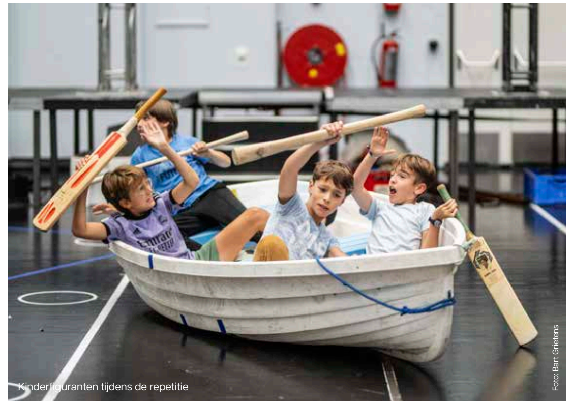
Kinderfiguranten tijdens de repetitie

Het lied 'Old Joe has gone fishing' ('Ouwe Joe ging eens vissen') is een uitstekend voorbeeld in de opera dat illustreert hoe Britten de menigte op een muzikale manier opzet tegen Peter Grimes. Terwijl de inwoners van het dorp schuilen voor de storm