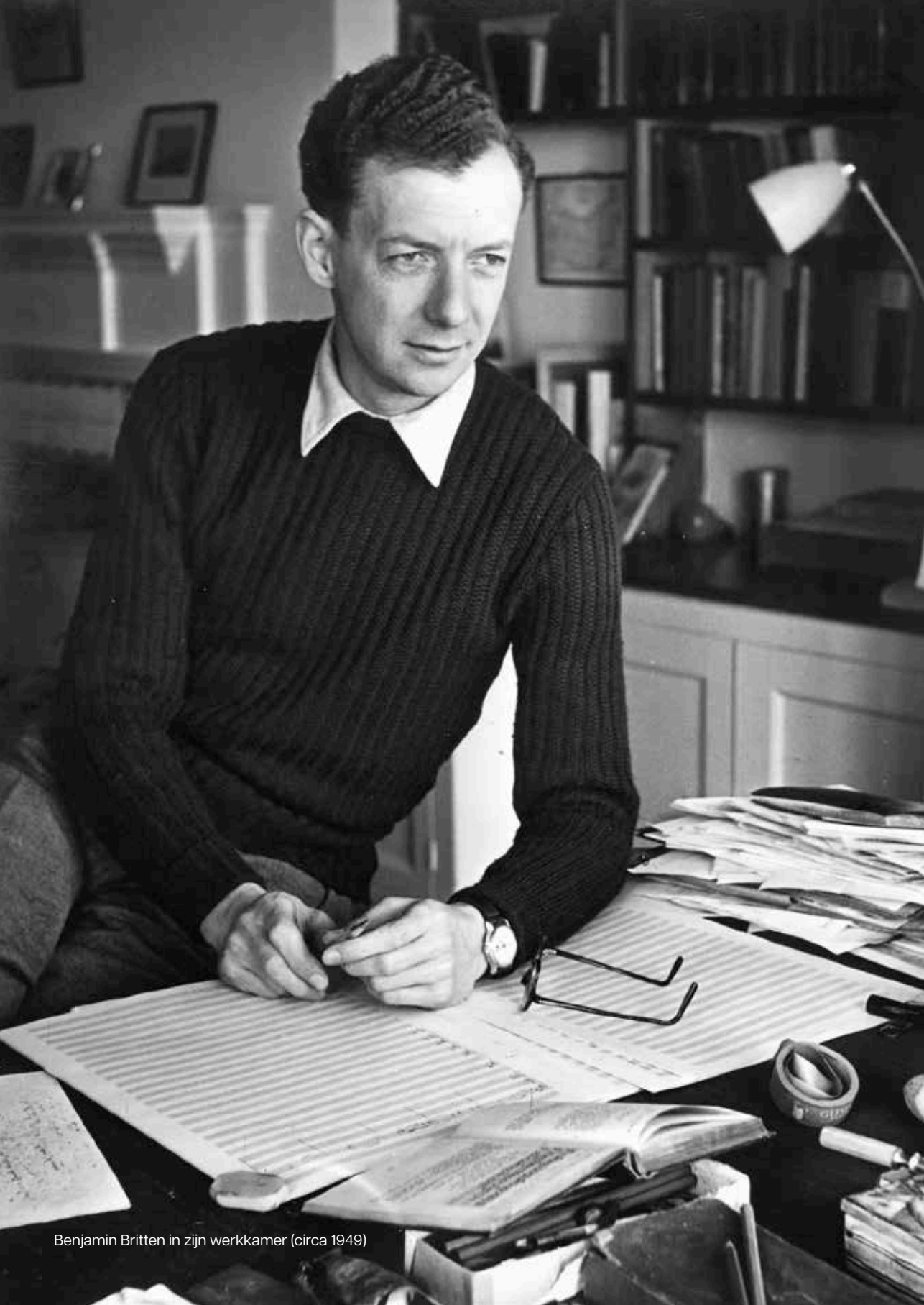
Benjamin Britten in zijn werkkamer (circa 1949)

Benjamin Britten over hoe Peter Grimes onstond