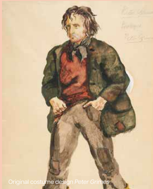
Original costume design Peter Grimes