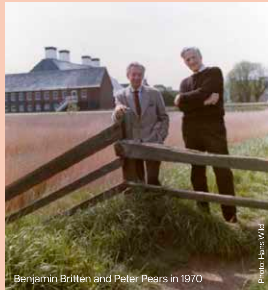
Benjamin Britten and Peter Pears in 1970

Benjamin Britten (1913-1976) was a British composer, conductor and pianist. He is seen as one of the most important composers of the twentieth century and a key figure in the revival of English opera. Britten's music is both accessible and innovative in style, combining tradition with modernity. In addition to operas – notably Peter Grimes and Billy Budd – he wrote orchestral works, chamber music and vocal compositions. His life partner was the tenor Peter Pears, with whom he also enjoyed a fruitful and intense professional relationship. Peter Grimes too was a joint effort, with the title role written for and first performed by Pears.