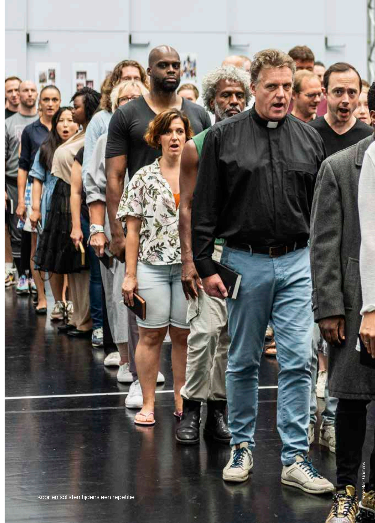
Koor en solisten tijdens een repetitie

Tekst: Eric Walter White Bewerking & vertaling: Niels Nuijten