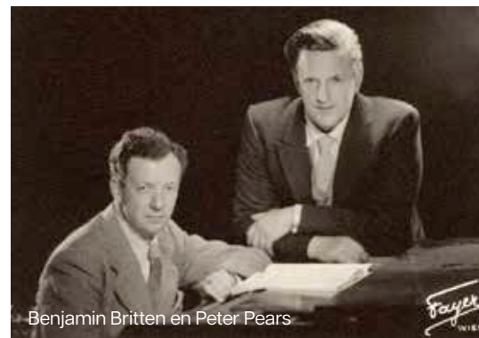
Benjamin Britten en Peter Pears

Benjamin Britten en Peter Pears emigreren samen naar de Verenigde Staten. Tijdens zijn