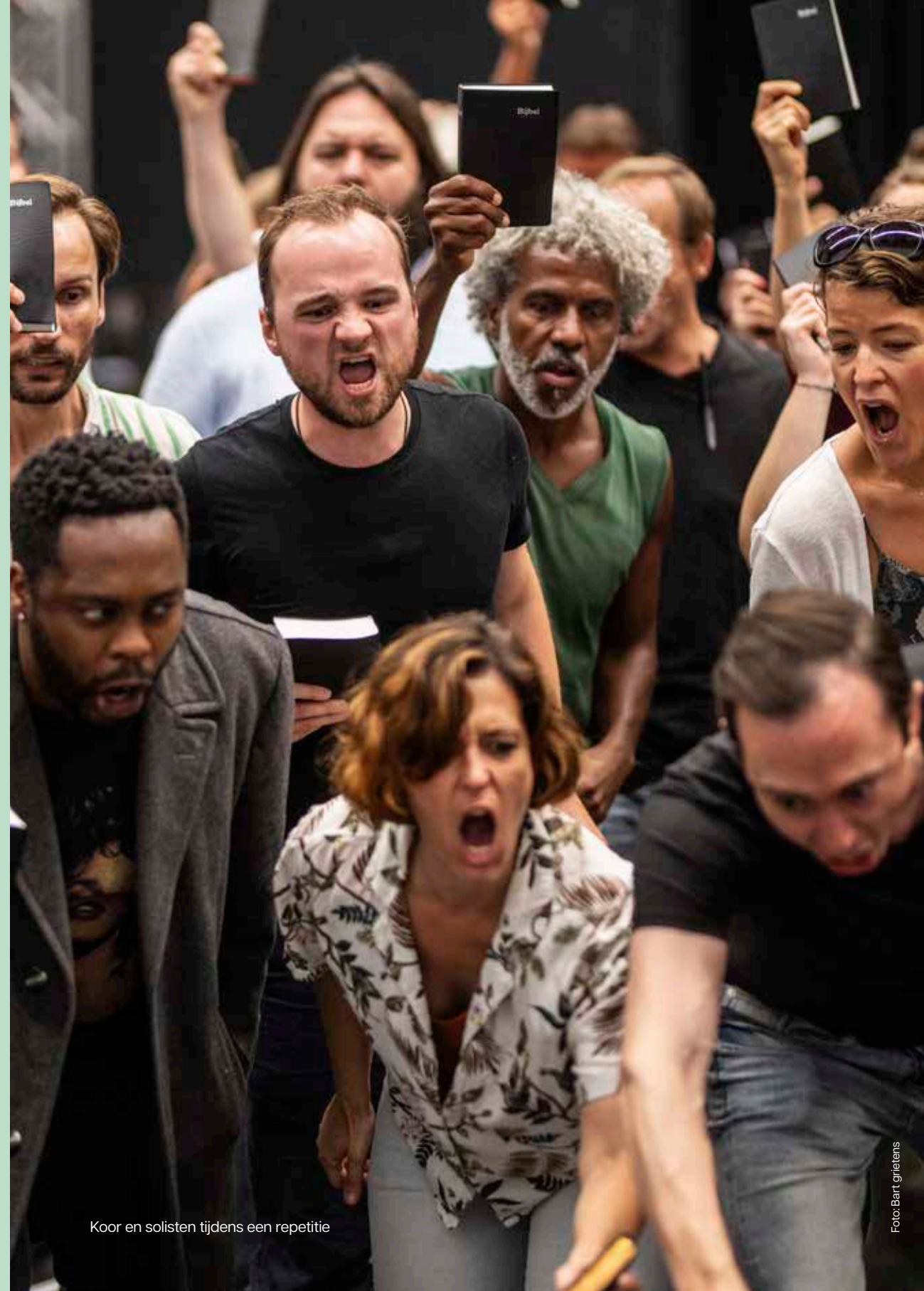
Koor en solisten tijdens een repetitie