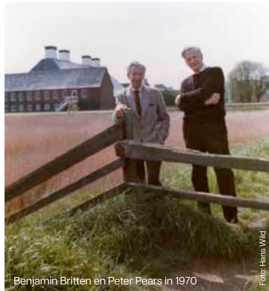
Benjamin Britten en Peter Pears in 1970

→ Lees meer over het compositieproces van Peter Grimes op pagina 17.